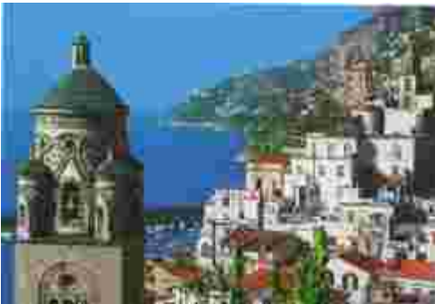
La côte amalfitaine.

D'autres îles d'une majesté surprenante émergent de cette mer aussi bleue que la voûte céleste. Je pense à l'île de Procida, fascinante, et bien sûr à Ischia, belle île volcanique qui fait face à Naples et abrite les thermes de Casamicciola. Toutes ces îles et même tous ces gros rochers perdus en mer sont généralement habités. Les gens y vivent naturellement du tourisme et de la pêche mais parfois même de cultures et d'élevage. Là-bas, le lait et la viande sont hautement réputés pour leur goût délicieux, car l'herbe dont se repaissent ovins et bovins y possède des caractéristiques particulières. Mais si vous allez sur l'une de ces îles, n'oubliez surtout pas de tendre l'oreille et d'écouter le chant des pêcheurs : il est si envoûtant !