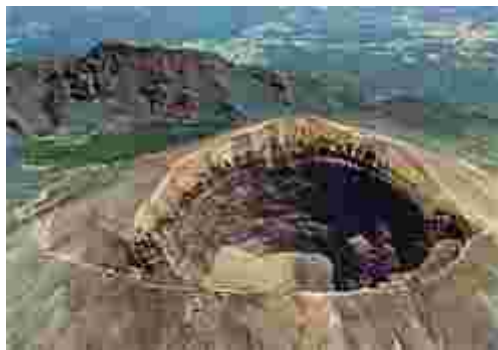
Le cratère du Vésuve

C'est au sein de cette Campanie assoiffée que se niche mon village natal. Naples, nommée "la gentille", est la capitale de cette vaste région. C'est une ville mondialement connue, ne serait-ce que par son magnifique golfe sur la mer Tyrrhénienne, lequel est dominé à quelques encablures de là par le fameux volcan Vésuve qui, il y a fort longtemps, exactement en l'an soixante-dix-neuf après Jésus-Christ, a enseveli, sous un énorme amas de cendres et de scories, les trois célèbres petites villes de Pompéi, Herculanium et Castellammare de Stabies, où aujourd'hui encore bon nombre d'archéologues continuent le long et lent labeur de recherche de vestiges. Ces spécialistes infatigables mettent au jour des temples, des édifices civils, des quartiers d'habitation, des demeures patriciennes, des peintures murales dont certaines étonnent par leur état de conservation, car il ne faut point perdre de vue que les cendres et les scories du volcan Vésuve sont perméables ; par voie de conséquence, l'eau qui y pénètre ne stagne pas sur les peintures et s'en va tout au fond, au niveau du sol existant avant l'éruption. Il reste cependant sous ces scories tant et tant d'autres secrets jalousement gardés que les chercheurs s'obstinent à découvrir. C'est qu'avant ce désastre qui s'abattit sur cette contrée de Campanie d'une incontestable beauté, les Romains nantis se rendaient notamment à Pompéi pour passer des vacances idylliques dans des maisons luxueuses.