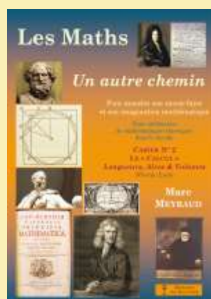
Cahier N°2 Longueurs, Aires & Volumes Voir le sommaire