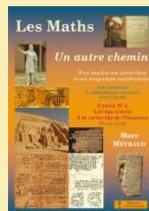
Cahier N°4 Les équations Voir le sommaire