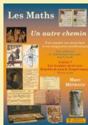
Cahier N°7 Les gammes musicales Voir le sommaire