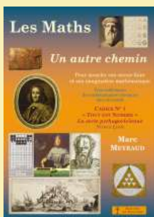
Cahier N°1 La secte pythagoricienne Voir le sommaire