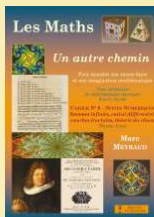
Cahier N°6 Les suites numériques Voir le sommaire